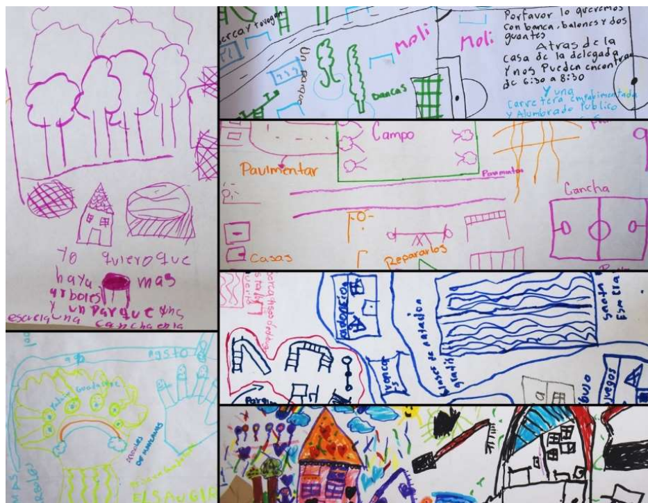
Collage de dibujos de la participación ciudadana por niños y jóvenes en localidades rurales.

Resultados de las mesas de niñas, niños y adolescentes en zonas en desarrollo.