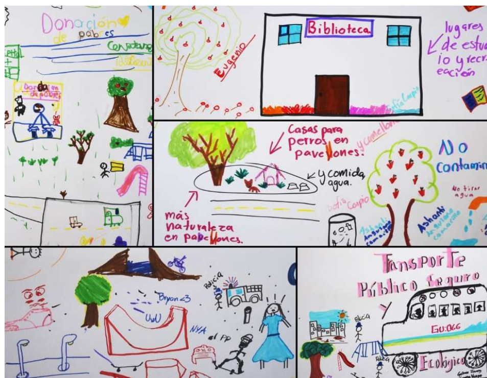
Collage de dibujos de la participación ciudadana por niños y jóvenes en localidades urbanas.